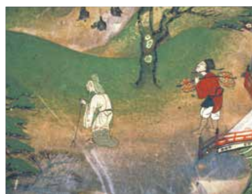
山頂を目指す老人

「丁字型」になって持ちやすくなっています。 同じ時代の「信貴山縁起絵巻」でも、別れた弟を探し求める姉の尼公が出会う老人も握りが「丁字型」で二又の杖を突いています。尼公は一本の棒状です。 従者を伴って山頂を目指す老人も同じように二又の杖を突き、握り部分が「丁字型」です。東大寺は、教科書にも登場する四天王像を安置する「戒音浄土図」には、山の上にいる観音の説法を拝聴しようと