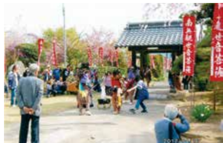
観音祭りの日 獅子舞の奉納

宗祖伝教大師一千二百年大遠忌御祥当にあたり、浄法寺御住職様の御理解を頂き、浄法寺金色御尊像前にて群馬教区諸大徳各位と多野部伝道師の皆様と共に、報恩謝徳の思いを込めて、お勤めができましたこと、誠に有り難く嬉しく存じます。また、教区内外の皆様より御