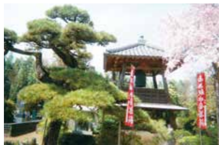
梵鐘(江戸時代) 鐘樓堂(戦後再建)