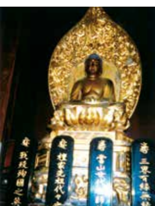
本尊 阿弥陀如来座像(鎌倉時代)

宗祖伝教大師一千二百年大遠忌御祥当にあたり、浄法寺御住職様の御理解を頂き、浄法寺金色御尊像前にて群馬教区諸大徳各位と多野部伝道師の皆様と共に、報恩謝徳の思いを込めて、お勤めができましたこと、誠に有り難く嬉しく存じます。また、教区内外の皆様より御