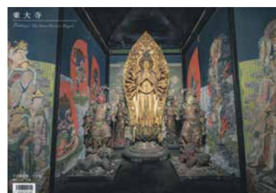
東大寺千手堂：千手観音厨子

る観音の説法を拝聴しようとする観音の脇に、山頂を目指す老人も同じように二又の杖を突き、握り部分が「丁字型」です。東大寺は、教科書にも登場する四天王像を安置する「戒音浄土図」には、山の上にいる観音の説法を拝聴しようと