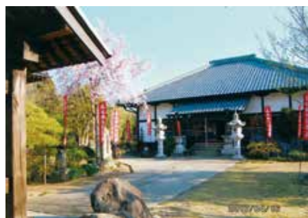
山門から眺める本堂